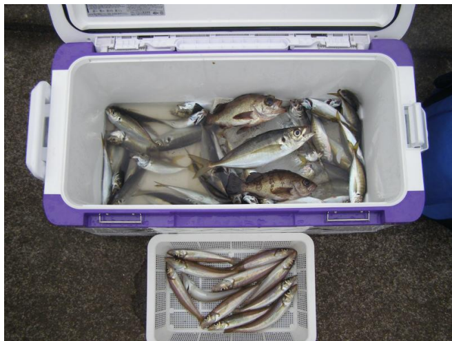
釣果例; 小ぶりですが、味は最高!