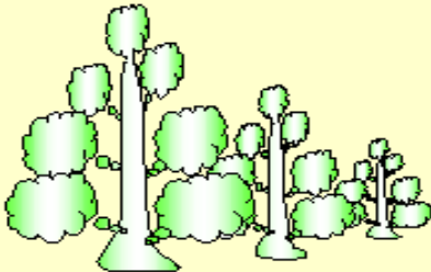
植樹は CO2 吸収活動

実績として、参加者4,519名、提出者4,222名でいずれも昨年より増えています。昨年に比べCO2排出量は、電気の部で354トン増加、ガスの部で81トン削減となり、トータルでは273トンの増加に終わりました。