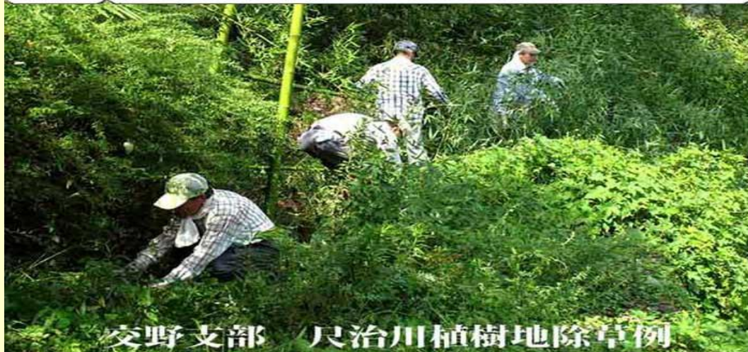
交野支部 尺治川植樹地除草例

これからもできる範囲で参加いただき、地域と連携した温暖化防止活動へと成長させましょう。