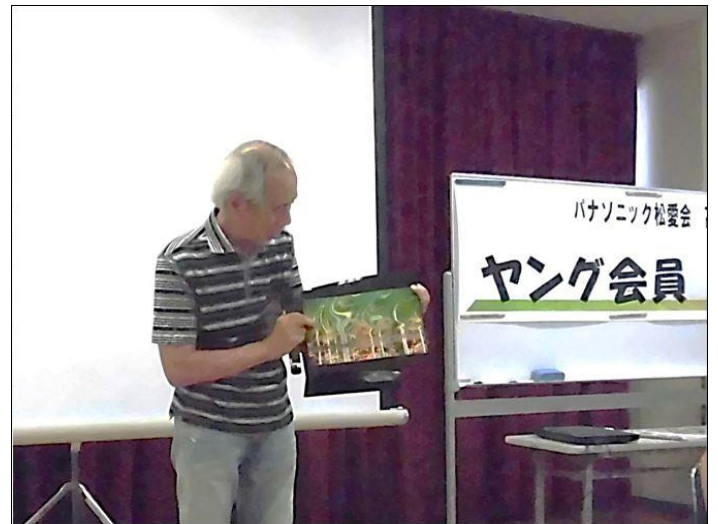
同好会責任者の説明