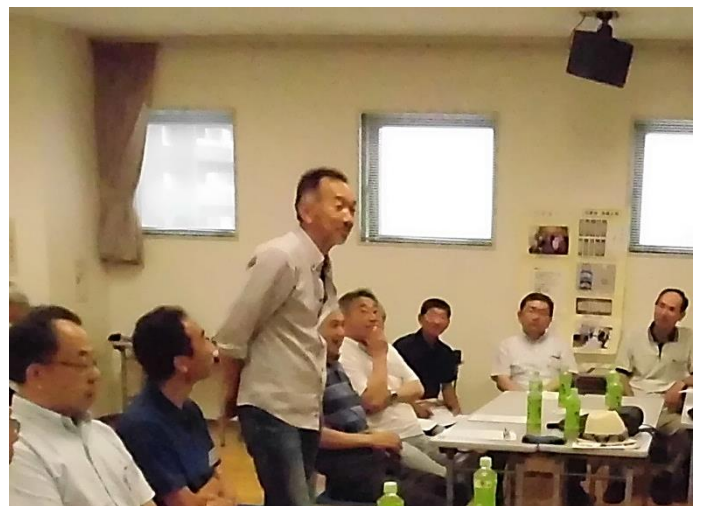
ヤング会員懇談会 参加者の自己紹介