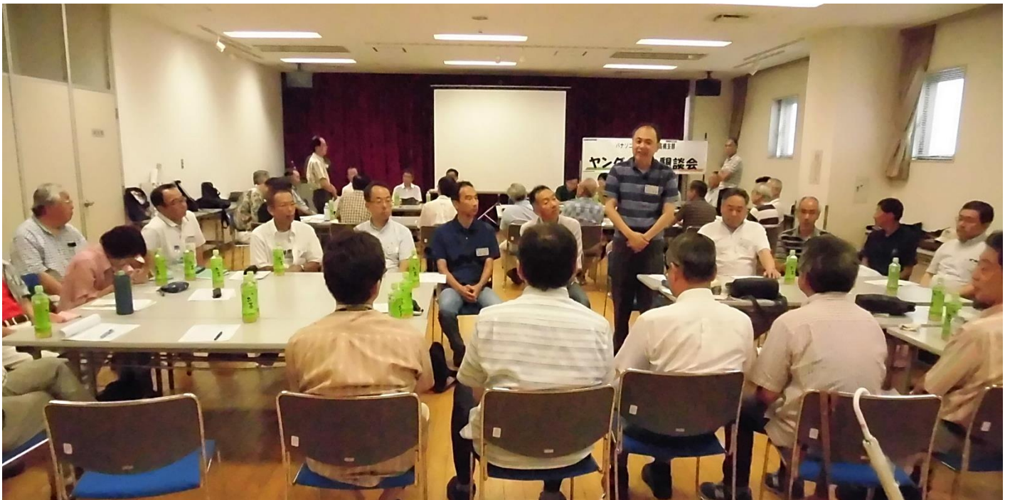
会場風景（2組に分かれて自己紹介）