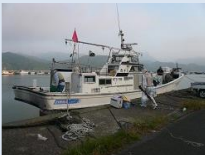
二日目早朝、西洋丸に乗り込みます