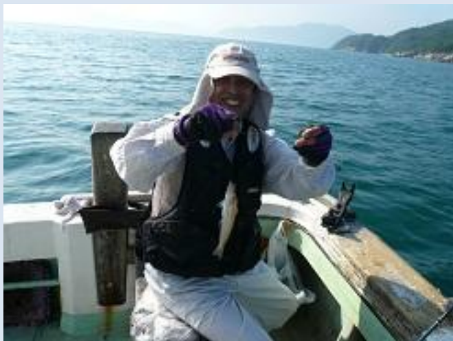
釣れると、笑顔がこぼれます