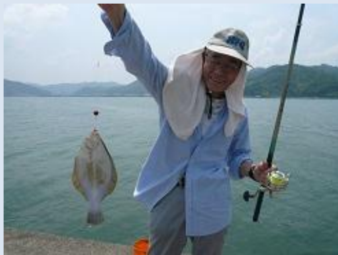
カレイが釣れました！