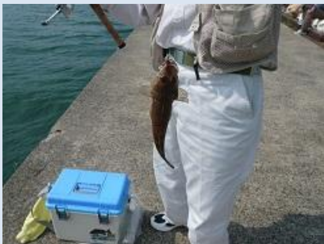
こちらは、コチがあがりました