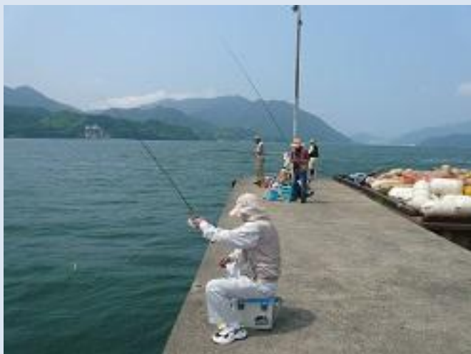
波止場に到着、早速竿を出します