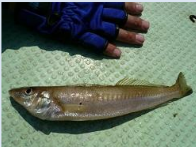
今回の大物キスです（25.5cm）