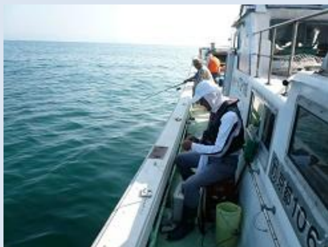
キスの釣り場に到着、早速竿を出します