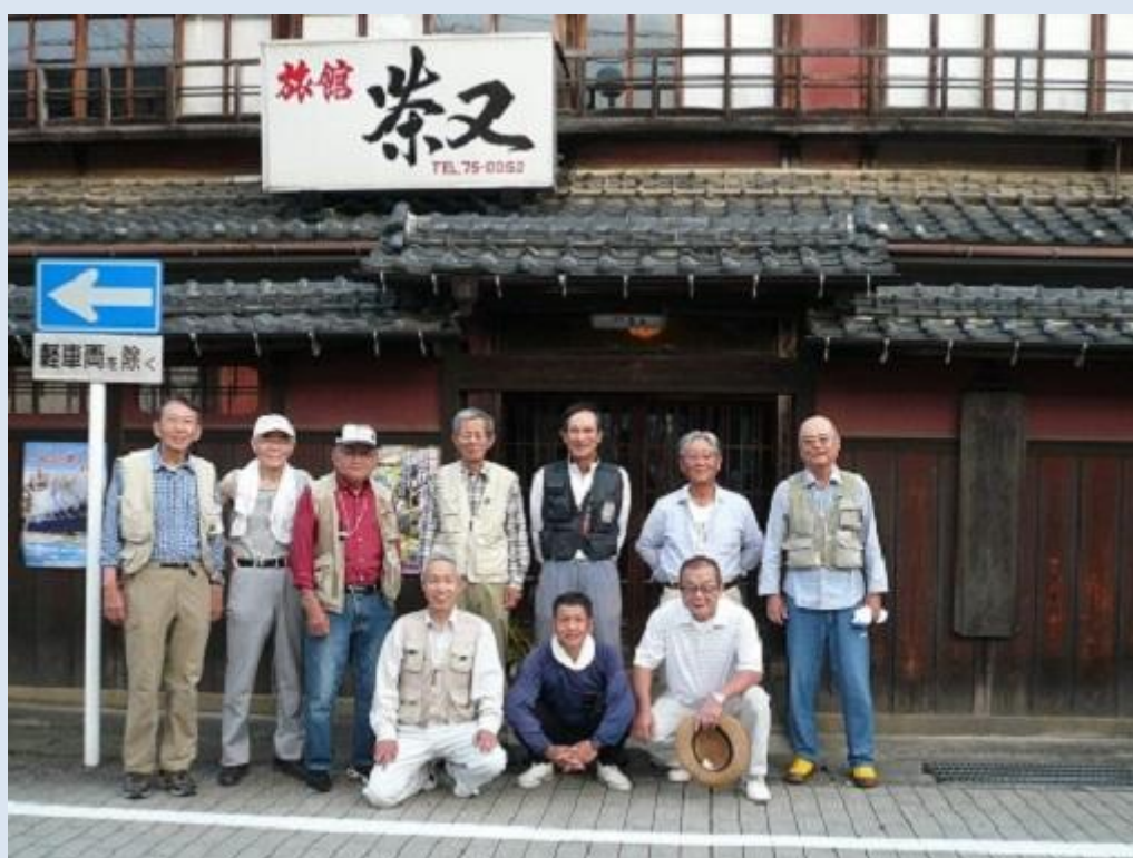
皆様、参加ありがとうございました