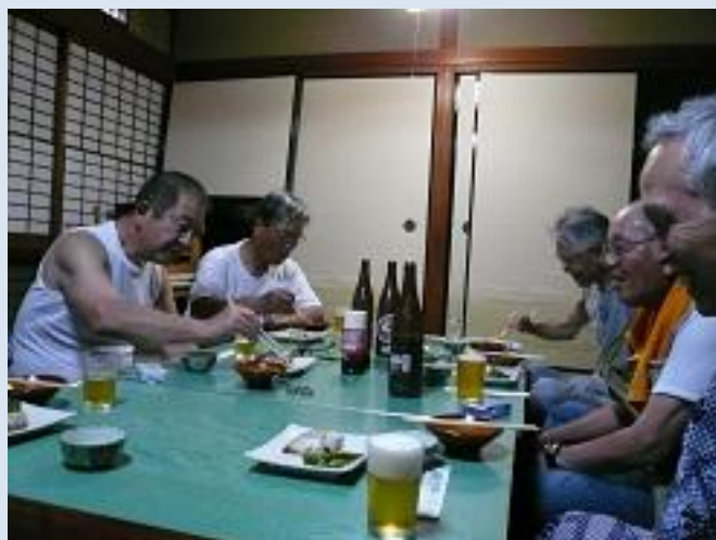
一日目の夜、宴会で親睦を深めました