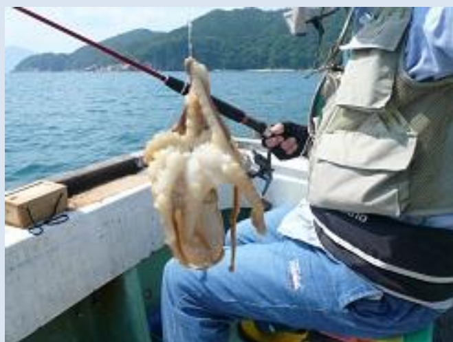
なんと、イダコが釣れました