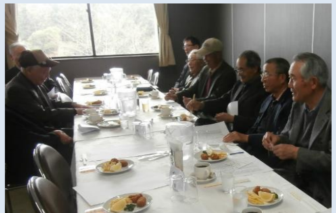
コンペルーム風景