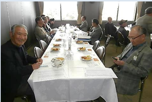
コンペルーム風景