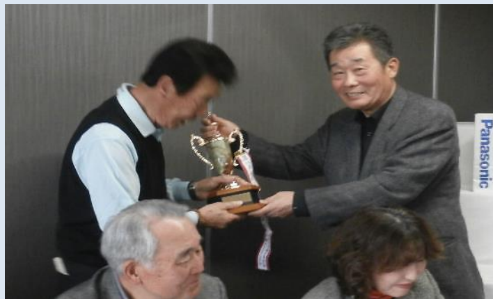
服部さんへの優勝カップの授与