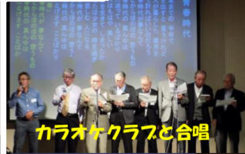
カラオケクラブと合唱