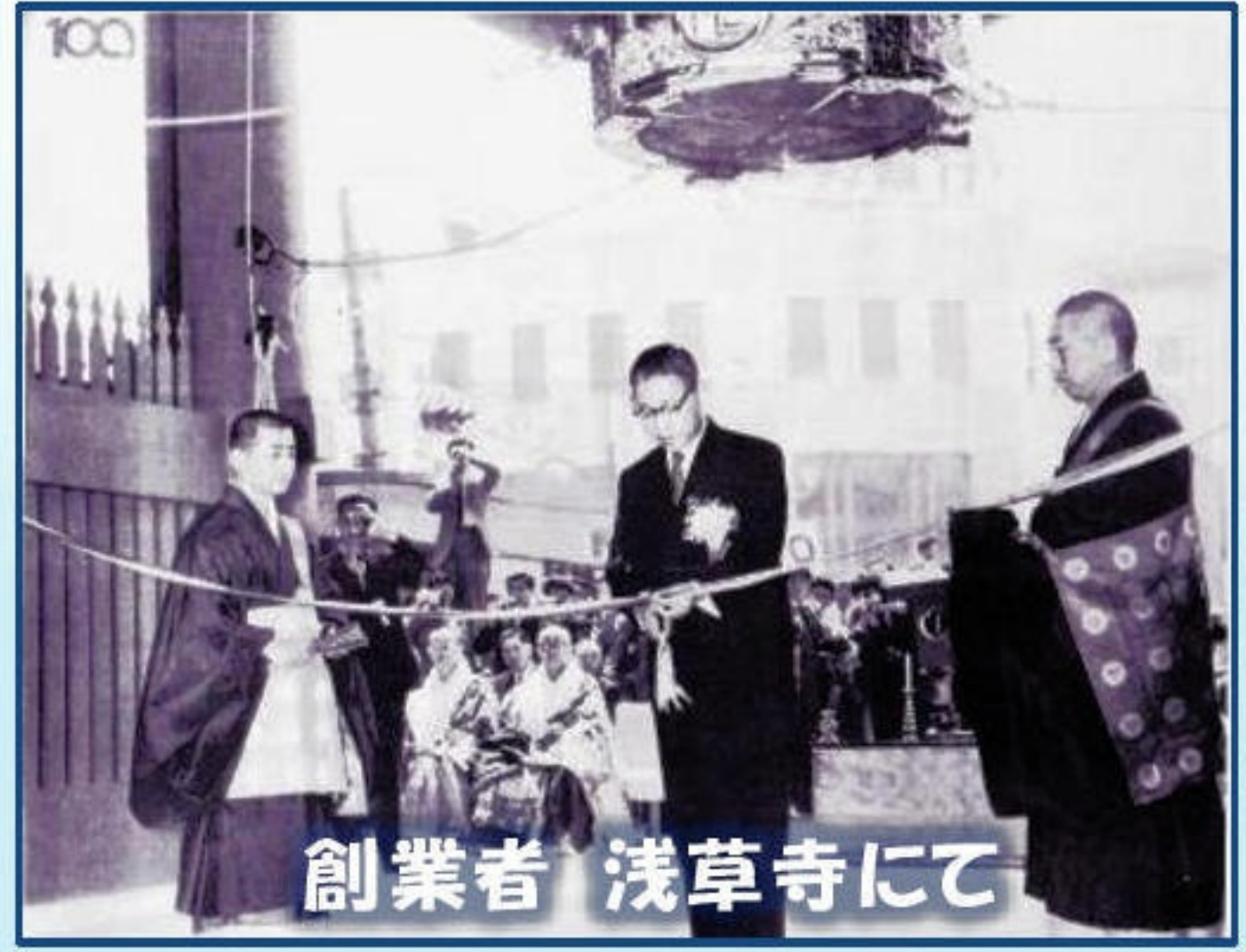
創業者 浅草寺にて

「明るく・元気で・楽しい」湘南支部を目指したいと思っておりますので、宜しくお願い申し上げます。