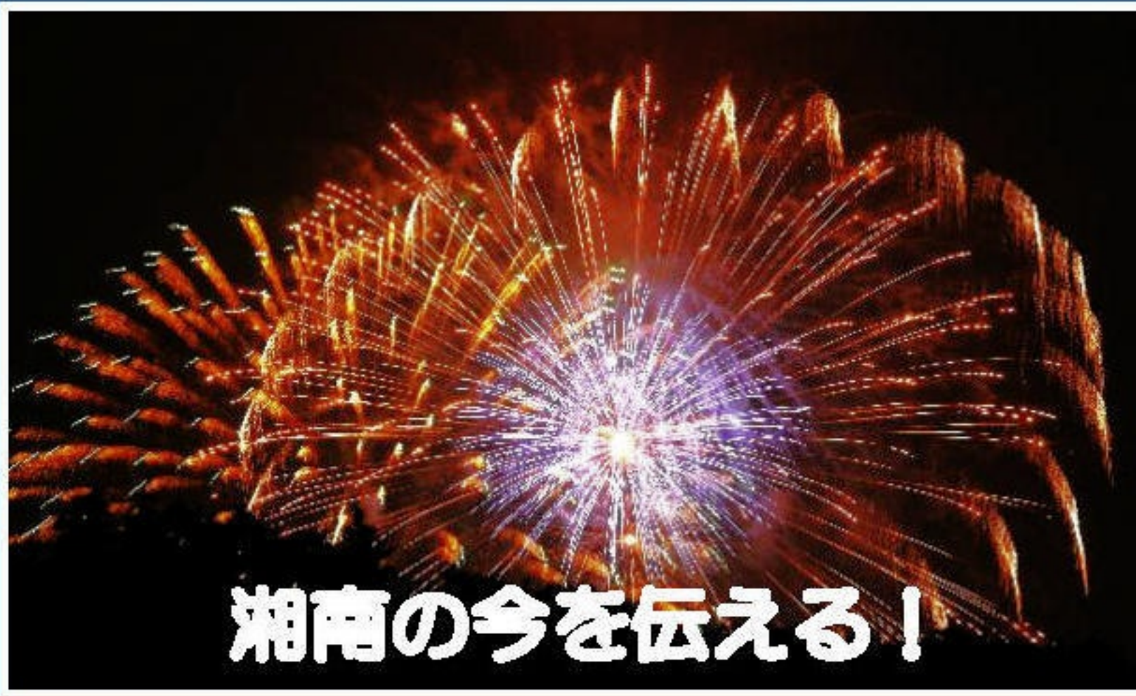
湘南の今を伝える！