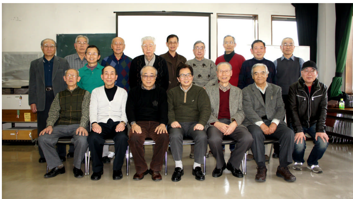
映像北大阪・寝屋川市映像協会との3映像団体交流会