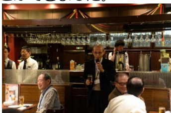
多湖新会長の音頭で乾杯