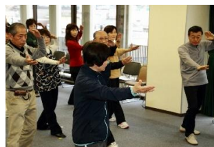
出来上がってきます