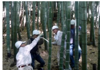
宙ぶらりんを切っています

次回は、28年4月9日(土)と16日(土)に筒掘りを予定していますのでご参加をお願い致します。なお、初めてご参加頂く方は、京都支部の担当地区委員にご相談ください。