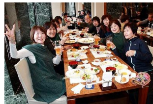
佐谷先生も一緒に