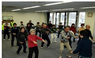
先生について学びます