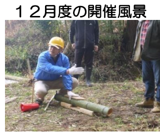
エコリレー小牧さんの竹筒づくりの作業説明