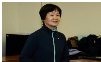
佐谷先生の紹介の後