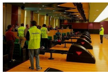
挨拶で開会しました