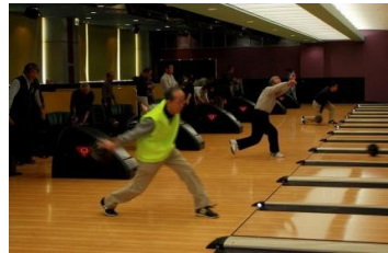
笛を合図にゲームスタート