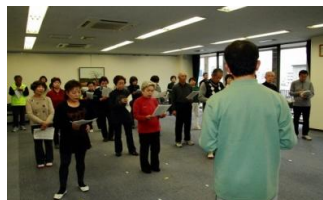
長行司さんの司会で開会