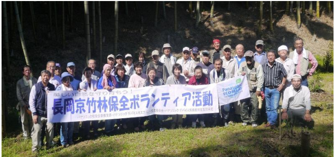
10月開催の全員での記念撮影

12月12日(土)に長岡京市奥海印寺の鈴谷竹林で竹林整備のボランティア活動を実施しました。