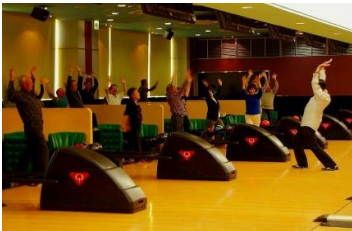
得て準備体操を行いました