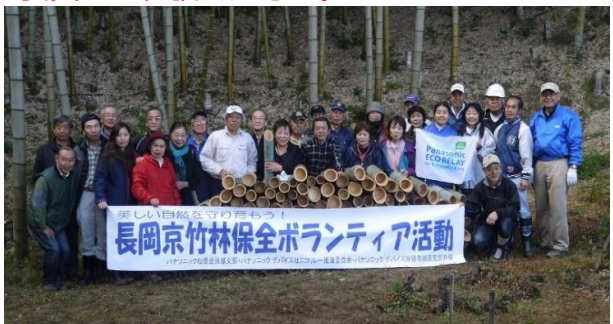
12月開催の全員での記念撮影