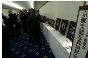
写真同好会の作品展