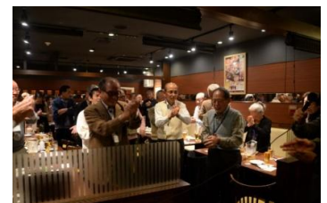
1本締めでおしまい