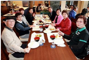
近くのホテルで食事会