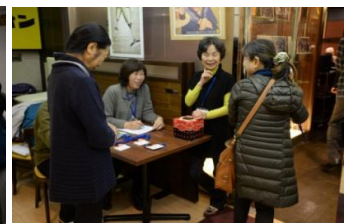
参加者が集まってきました