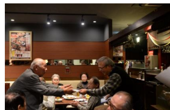
商品券が当たりました