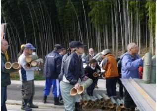
竹を運んでいます