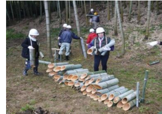
成果を確認しています