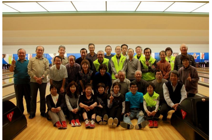
参加者全員の集合写真

京都支部では「健康づくり」の活動に取り組んで3年目になります。仮想ウォークとして「四国八十八ヶ所巡霊の旅」の完歩を目指すなどの取り組みも行っています。