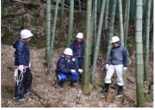
慎重に切っています