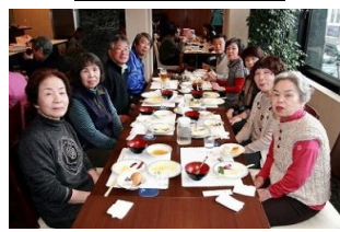
講習終了後は全員で