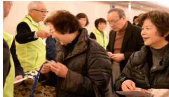
皆さん受付に集まって来ます