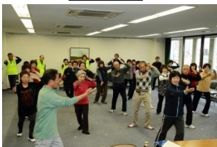
最後には上手にできました