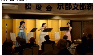
あすなるフルートあんさんぶる