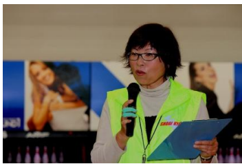
森岡担当リーダー