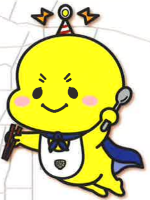
豊橋カレーうどん マスコットキャラクター Yeah!Rō イエローくん