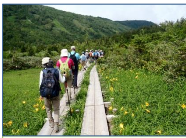
ニッコウキスゲの遊歩道