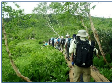
展望湿原を目指し歩む