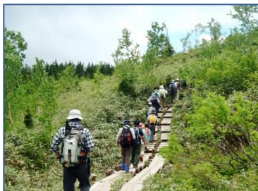
休憩場所モウセン池は目前