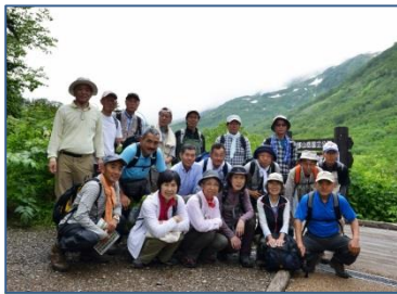
スタート前の集合写真