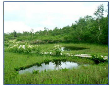
高層湿原の遊歩道