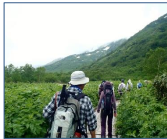
いよいよスタートです