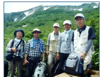
中部5人衆元気です