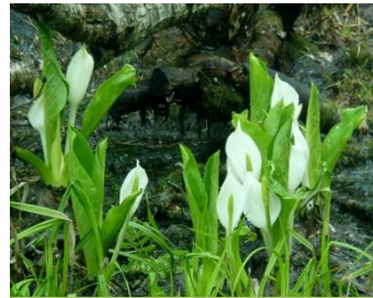
ミズバショウ湿原