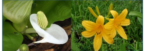
梅池自然園の高山植物