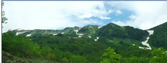
梅池自然園より白馬連邦を望む