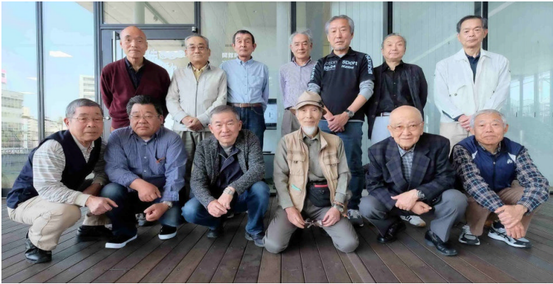
[中部フォトクラブメンバー]

私たちは、愛知・岐阜に在住するパナソニックOBで写真好きが集まったグループです。私達クラブメンバーは写真キャリア・得意なジャンル(風景・花・スナップ等々)は様々ですが、毎月の定例会での講師からの指導、撮影会、他グループとの交流を通じ日々研鑽しています。年間を通じて活動してきた成果を、下記日程でクラブ写真展を開催する運びとなりました。今回の展示作品は、課題テーマ「風と光」作品と自由作品で各自2点の出展となっています。OBの皆様にかかれましては、是非とも会場まで足を運んで頂き作品をご覧頂くとともに、ご感想、ご講評を頂ければ幸いです。